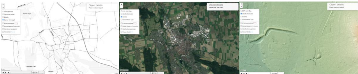
Abbildung 4-3-1: Die verschiedenen Hintergrundkarten: Stamen Toner Light, Satellitenbilder, DGM (v.l.n.r.)