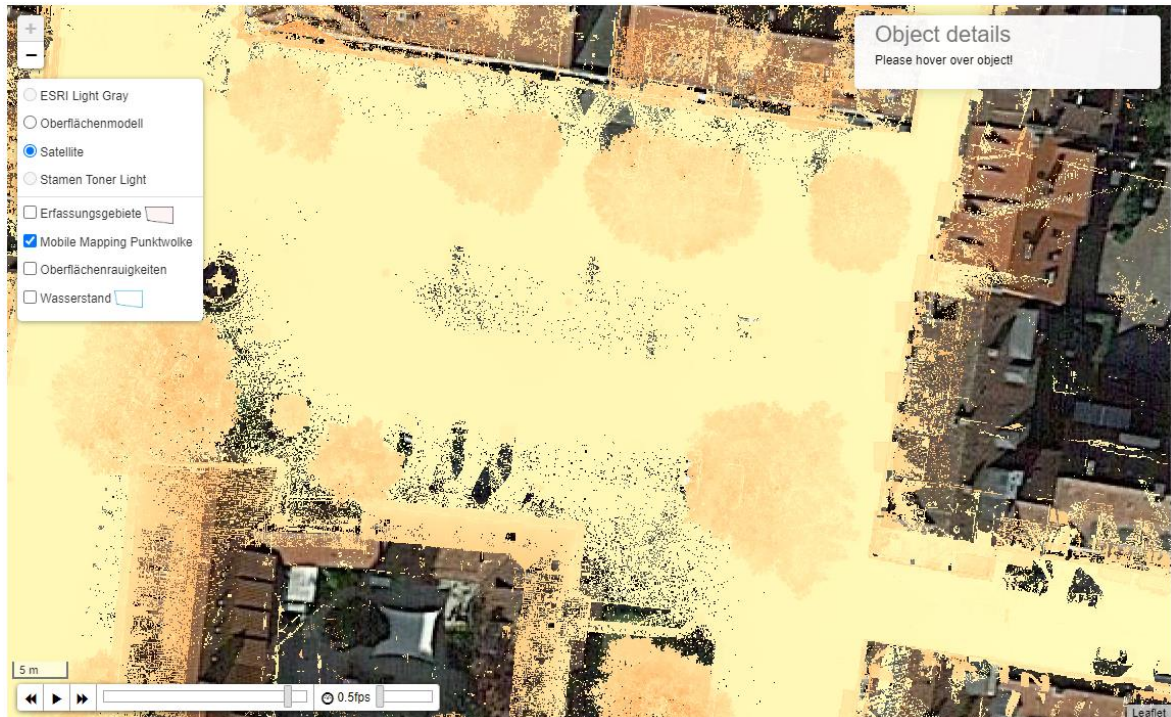
Abbildung 4-3-2: Die erfasste Punktwolke auf der Satellitenbild-Hintergrundkarte. Die Farben der Punktwolke verdeutlichen die Höhen (grün: niedrig, rot: hoch).